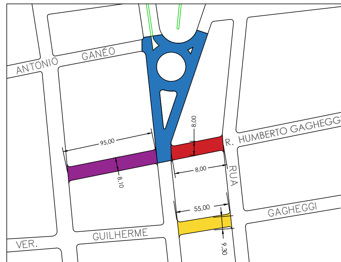
DETALHE GEOMÉTRICO RUAS HUMBERTO GAGHEGGI E GUILHERME GAGHEGGI E ROTATÓRIA sem escala