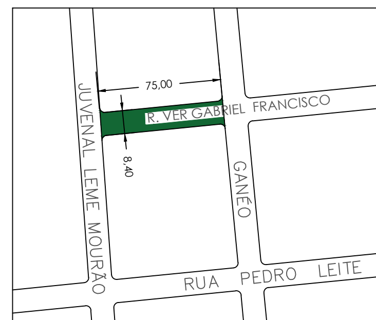
DETALHE GEOMÉTRICO RUA VER. GABRIEL FRANCISCO sem escala